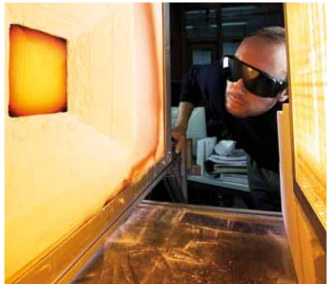
Teststand für Absorberentwicklung.