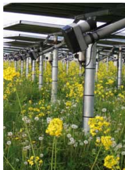
Bild links: Heliostate.